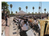
四日市農芸高校吹奏楽部

音楽こそバリアフリー。音楽を心の底から楽しもう！頭も心も体も全てを開放して音楽も海もそこにいる全て人といっしょに楽しく、だれでも参加可能な演奏会を開催します。